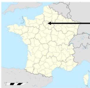
Versailles Ile de France