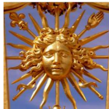
Document 4 : Les ..... du château de .....