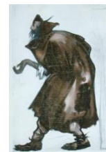
ein armer Mann